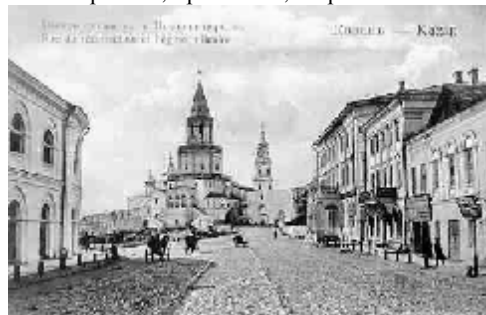
Вид Спасской башни с улицы Проломная

В X веке на реке Казанка (Казансу), невдалеке от её впадения в Волгу, закладывалась древняя булгарская крепость. За это время город не раз оказывался в водовороте истории, не раз переходил из рук в руки, подвергался разрушениям, но Казань возрождалась снова и снова. И вот уже почти десять веков стоит Казань на высоких берегах Волги и Казанки, окруженная заповедными лесами и золотыми песчаными пляжами. Белокаменный город живописно раскинулся на обрывистых склонах и холмах, прорезанных глубокими оврагами, протоками, озерами.