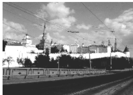
Вид Казанского Кремля