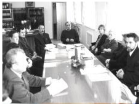
Первое заседание Совета по ДО

В следующих номерах газеты мы продолжим разговор об организации системы дистанционного обучения в академии, требованиях к учебно-методическим материалам по ДО и выполняемых в связи этим работах.