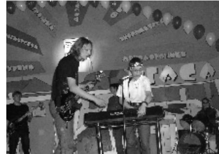
Выступление студентов ИАиД

лось, не чувствовалась «рука режиссёра», однако от этого они только выиграли. Впечатление было такое, что студенты все придумали и сделали сами, их концертные программы заставили нас, преподавателей, вернуться в студенческую юность.