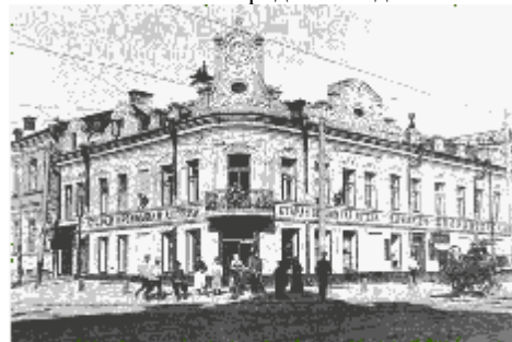
Аптека на улице Баумана

А.И. Герцен через Казань направлялся в ссылку. Город на Волге посетили и российские самодержцы – Петр I, Екатерина II, Павел I. Г.Р. Державин считал Казань своей родиной; здесь жили писатели Л.Н. Толстой и А.М. Горький, артисты Ф.И. Шаляпин и В.И. Качалов, ученые А.М. Бутлеров, Н.И. Лобачевский, Ш. Марджани и К. Насыри. Этот список можно продолжать долго.