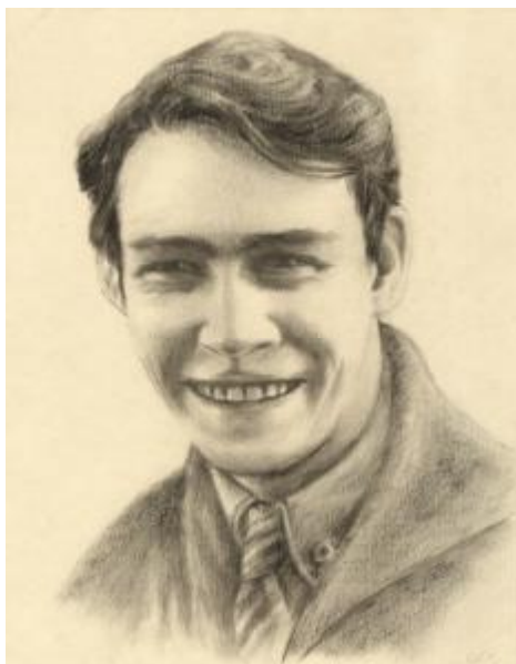
Автор портрета М. Шамсутдинов

- Входит татарин. - Я на татарском Вам прочитаю