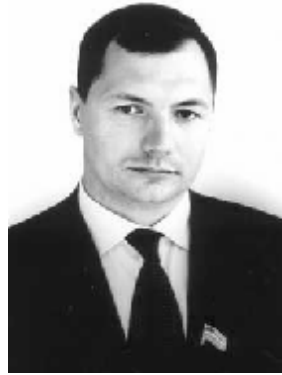
Марат Шакирзянович Хуснуллин