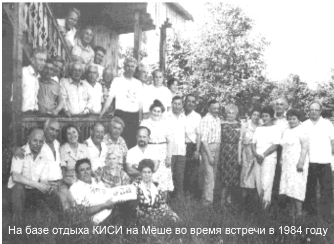
На базе отдыха КИСИ на Мёше во время встречи в 1984 году

Наш курс с первых дней учебы активно включился в общественную жизнь института. Уже на втором курсе активистами комсомола, профсоюза, СНТО ДОСААФ, редколлегии, спорткомитета института были наши ребята