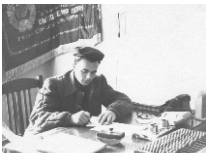
Самойлов Л.И. Южный Урал. На строительстве химвкомбината «Маяк». В конторе Краснознаменного участка. 1957 год.

Следует отметить, что на протяжении всей учёбы наш курс был в тесном общении с тремя предшествующими курсами, брали с них пример, и это помогало нам в учёбе и студенческой жизни. Старшекурсники были для нас путевой звездой. Окончив институт, все мы уверенно приступили к работе. Большинство были распределены на производство, строительство объектов промышленности, жилья, соцкультбыта.