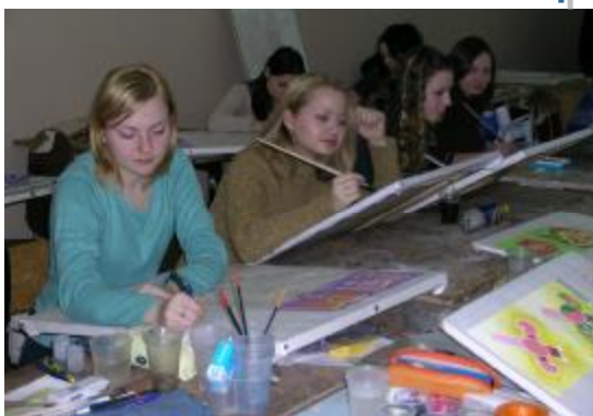
«Сплошняк» у студентов-архитекторов