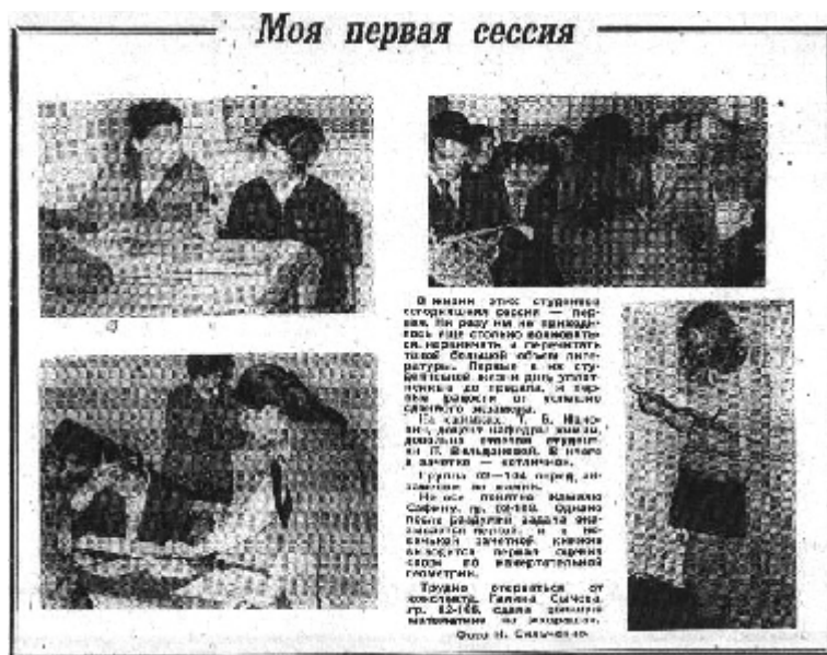
«Молодой строитель», 1975, 13 декабря.