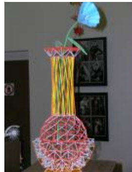
Творческие работы студентов факультета дизайна