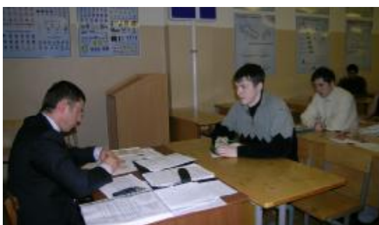
Экзамен у студентов ИТС

Идёт напряжённая пора зимней экзаменационной сессии. Для кого-то это первое серьёзное испытание в студенческой жизни. Первые слёзы и первые радости.