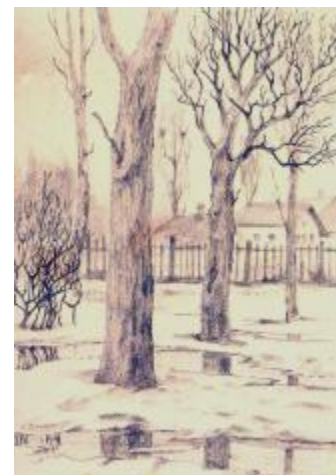
Я.Ф. Козырев «Весна», 1.IV.1943 г.

Предвестник зорь и юности певец, Не в честь ль твою я слышу жизни слоги? Не ты ль любви негаснущей творец, Где суть твою предначертали боги?