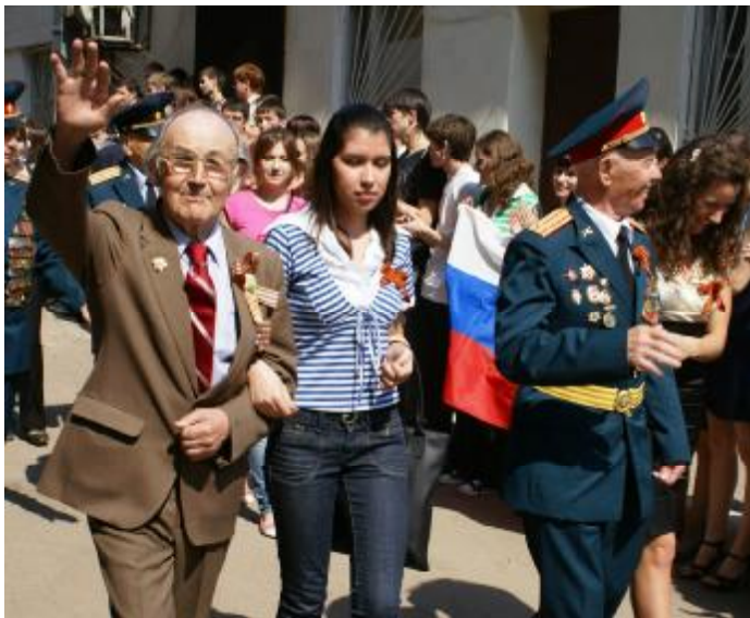
День Победы, 2010 год

Продолжение, начало в № 3 (1027), март 2011 г.