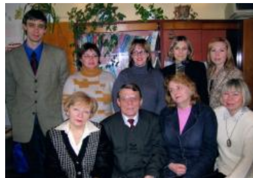
Кафедра экономической теории

В итоге сложился дружный и сильный коллектив, где никто не подсиживает друг друга, где все вместе не только решают общекафедральные задачи, но и справляют все праздники и дни рождения, где все чувствуют локоть друг друга и постоянную поддержку заведующего. Глаза добрые, наблюдательные, но упаси бог что-то не так сделать, не во благо кафедры, нарушить принятые институтом правила поведения – поправят так, что мало не покажется, и больше не захочется нарушать. Так и живём, радуясь, что на кафедру хочется идти, как в дом родной.