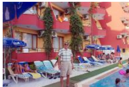
Алара. Отель «Полат»

Во время путешествия по Турции мы совершили интересные морские прогулки на яхтах. В открытом море свежий воздух, чарующие пейзажи прибрежных скал, пляжи, пещеры. Мы познакомились с Анталией и Аланией. Посетили торговые центры, магазины. Увидели изобилие разнообразных товаров. Увлекательные экскурсии оставили неизгладимое впечатление.