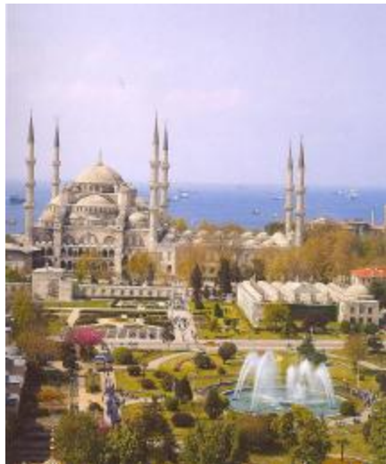
Мечеть Султан Ахмет

Конечно же, самое интересное место в Турции – это Стамбул. Расположен он на северо-западе полуострова Малая Азия, между Черным и Эгейским морями, на берегу пролива Босфор. В византийский период город получил название Константинополь, а затем Стамбул. Одним из прекрасных архитектурных памятников Стамбула является мечеть Султан Ахмет, построенная в 1616 году Султаном Ахметом I. Она называется «Голубой мечеть», из-за украшений голубыми изразцами, покрыта 30 куполами, имеет 6 минаретов, большой купол поддерживается четырьмя полукуполами и опирается на 4 колонны в форме ноги слона.